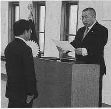
上園会長から感謝状が贈られた

埼玉県警備業協会(上)からの要請に基づき、4月17日～25日の間、東日園(園長)は、全警協一員に協賛し、被災地での活動に当たった。